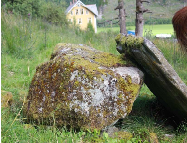
I Leivdalen, Otte-stein og steintavla